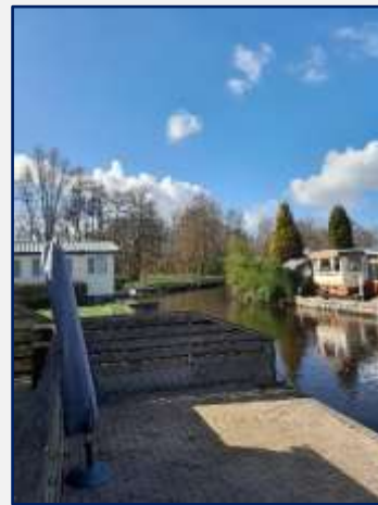
Uitzicht vanaf het terras aan het water

Het (sta)caravanpark De Leine te Kropswolde, heeft een nieuwe eigenaar en er is nog veel onduidelijk hoe het park zich gaat ontwikkelen. Het is namelijk al een ouder complex. Voor ons geen probleem want we hebben voor 6 maanden gehuurd. Echter de eigenaren van de stacaravans leven in onzekerheid. Er zijn al veel kavels leeg omdat mensen hun eigen plan getrokken hebben en naar elders verkasten. Onze stacaravan is van alle gemakken voorzien, eenvoudig ingericht, grote leefruimte, 2 slaapkamers, douche en keuken, dus alles wat we nodig hebben is aanwezig.