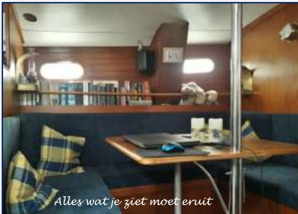
Alles wat je ziet moet eruit

Even terug naar het harde werken en veel organiseren. Met name, het bepalen wanneer beginnen we onderdeks met het inpakken van de "24-jaar gehamsterde/vergaarde inhoud van de Zeezwaluw". Wat kunnen we doen als we nog aanboord wonen en wat absoluut niet.