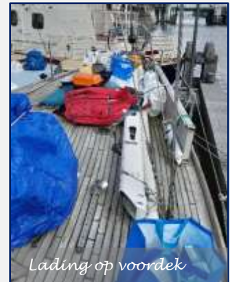
Lading op voordek

De spullen vanuit de boot op het voordek zetten, van het dek op de steiger aangeven en van de steiger op de kade zettenen daarna kan het pas de auto geladen worden.