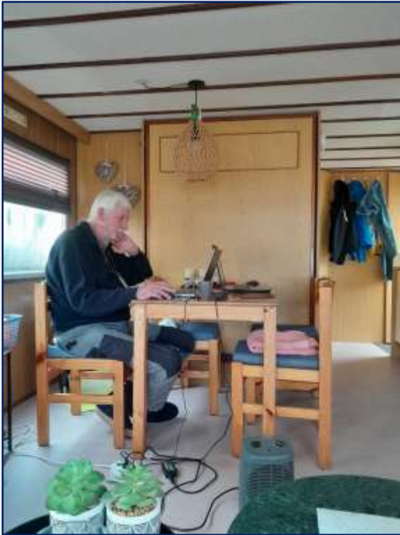
Eethoek en kantoor