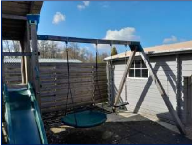
Speeltuig voor kinderen