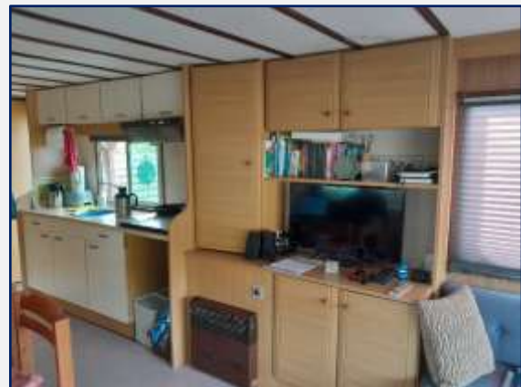
Entertainment hoe ken kombuis