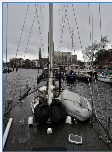
Fietsjes in hoes tegen mast