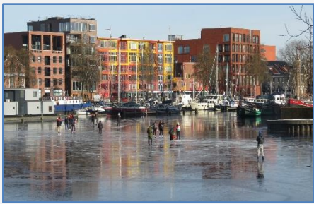
Sneeuw en ijs in de Oosterhaven