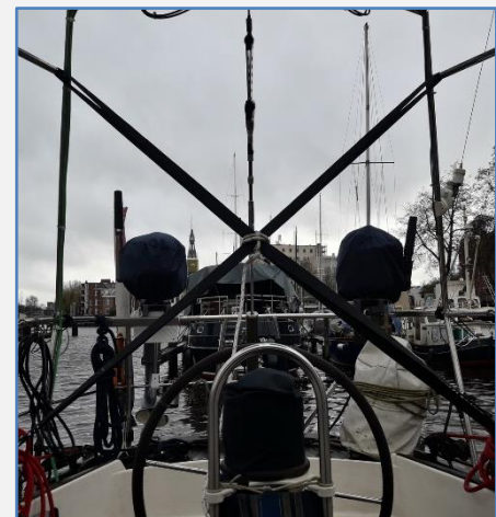
Spanbanden op het frame

De buurboot aan bakboord was net 2 dagen voor de storm preparatie vertrokken en konden we de stootwillen van BB ook allemaal aan stuurboord hangen als bescherming langs de steiger. De landvasten van 5 uitgebreid naar 7, zouden ons wel op de plek houden. Zo alles prima geregeld. Nu konden we niets anders meer doen dan wachten op wat komen gaat. Dat is best stressen want je kunt alleen maar wachten en luisteren naar de aanzwellende wind en regenbuien.