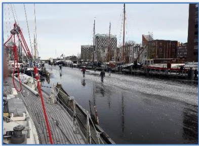
Schaatsen naast de Zeezwaluw

Dit jaar is de winter aan het huilen geblazen. In februari zeilen we van stormdepressie naar stormdepressie met elke dag regen. Veel gewone buien maar echte wolkbreuken zijn ook geen uitzondering. Amper zon waardoor de zonnepanelen in een winterslaap zijn gezakt en het maken van kleurenfoto's bijna zwart-wit foto's lijken. Maar we klagen niet hoor, we moeten het er mee doen.