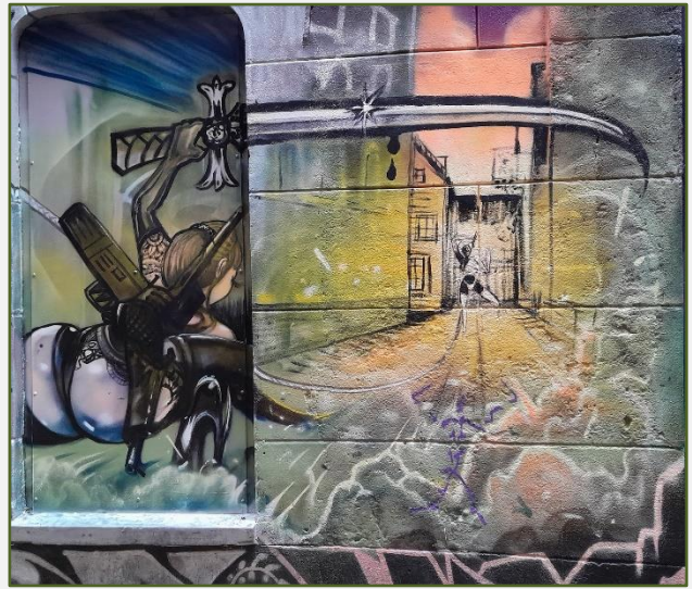
Schildering halverwege de Papengang