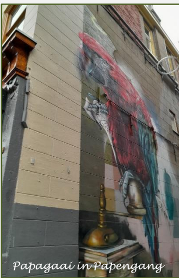
Papagaai in Papengang

De fotoserie is over de bezochte Street Art, waarvan de laatste 2 foto's zijn genomen in de Papengang in het uitgaanscentrum van Groningen. Voor de echt geïnteresseerden, volg deze link voor de achtergrond en de betekenis van deze Street Art.