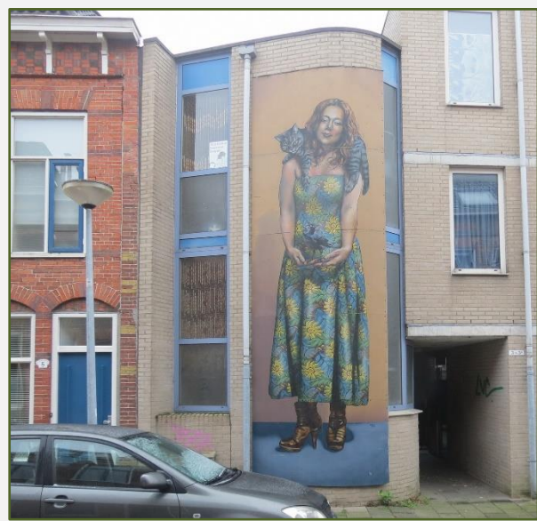
Sterlijk geklede vrouw