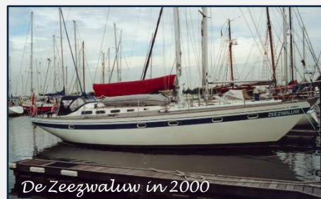
De Zeezwaluw in 2000

J a ja, tis wat dat ouder worden. Het komt met gebreken, ook voor bij ons Zeezwaluw'tje. Ze is inmiddels 39 jaar oud en wij bewonen haar al sinds 2002. Best al wel lang dus. Tijd om te faceliften, oude spullen te vervangen en hier en daar wat "op te leuken". Met andere woorden, een gevalletje van "wat doe je nu zoal op een bootje ...."