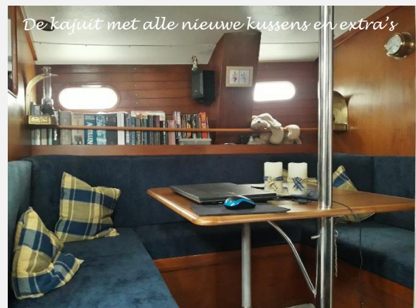
De kajuit met alle nieuwe kussens en extra's

Dat is al uitgetest bij het maken van de kussentjes uit de rugleuning van de oude IKEA-stof. Zelfs het kaartentafel bankje is niet vergeten! Het ziet er weer top uit en krijgen daar veel comfort voor terug.