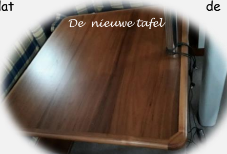
De nieuwe tafel

de nieuwe tafel gereed was voor eind maart.