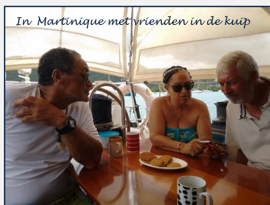
In Martinique met vrienden in de kuip

De kussens zaten perfect en we waren er erg blij mee. Maar na ongeveer 4 jaar was het schuimrubber ver uitgelubberd en voelden we na een halfuurtje de houten ondergrond weer. In 2014, in Las Palmas vonden we een bedrijf dat degelijk schuimrubber op maat kon snijden. Daar hebben we de beste zitkwaliteit schuim gekocht voor de kajuit en ons bed. De IKEA-bekleding kreeg een wasbeurtje en werd