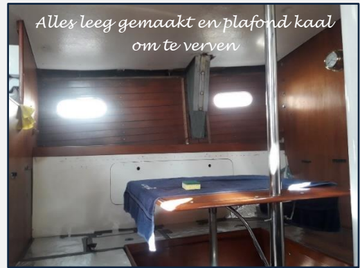
Alles leeg gemaakt en plafond kaal om te verven

We wilden namelijk niet meer rondrennen met verf of lak als de nieuwe kussens er waren.